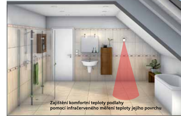
Zajištění komfortní teploty podlahy pomocí infračerveného měření teploty jejího povrchu

Prostorový bezdrátový ovládací prvek Touchline s infračerveným měřením teploty podlahy zajišťuje precizní regulování na požadovanou teplotu v místnosti s funkcí měření teploty podlahy. Zajišťuje tak hlídání požadované teploty na jejím povrchu pro dosažení maximálního komfortu podlahového vytápění. Dále slouží i jako ochrana, například dřevěných krytin proti jejich provoznímu přehřátí.